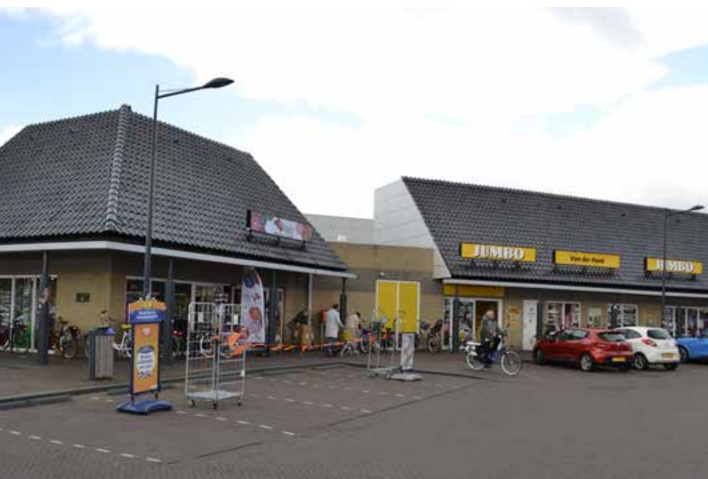
Links Hoeksch Gemak, rechts Jumbo

Voor Hoeksch Gemak ging Ardi met verschillende partijen in zee. Convenience Concept, onderdeel van Lekkerland Groep, verzorgt de cadeauartikelen die Ardi onder de zelfbedachte naam Cadeau Concept brengt. Voor speelgoed (Top1Toys) en huishoudelijke artikelen (Marskramer) schakelde hij Otto Simon in.