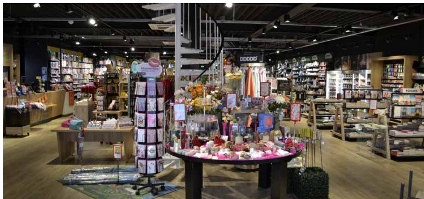
Hoeksch Gemak biedt heel veel gemak onder één dak

"Het eerste kwartaal van dit jaar is redelijk goed verlopen qua omzet, al heb ik heb natuurlijk nog geen vergelijkingsmateriaal. Wat sowieso duidelijk is dat Jumbo Hoeksch Gemak versterkt en vice versa; het is win-win. Dus achteraf ben ik heel blij dat ik deze stap heb genomen."